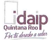
TABLA DE APLICABILIDAD AUDITORÍA SUPERIOR DEL ESTADO DE QUINTANA ROO