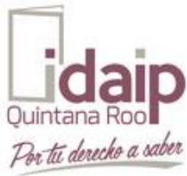
TABLA DE APLICABILIDAD PARTIDO VERDE ECOLOGISTA DE MÉXICO